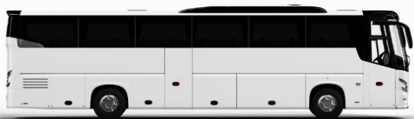
ตัวอย่างรูปภาพรถ 1 ชั้น

หากประเภทห้องที่ท่านริเวสมาเต็ม อาทิ เช่น ริเวสห้องพักเป็น TWIN BED หรือ DOUBLE BED ทางบริษัทขอสงวนสิทธิ์ในการปรับประเภทห้องพัก เป็นตามที่โรงแรมมีอยู่ โดยไม่ต้องแจ้งให้ทราบล่วงหน้า