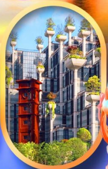
อาคาร 1,000 ชั้นไม้