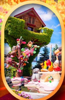
โรงงานช็อกโกแลต