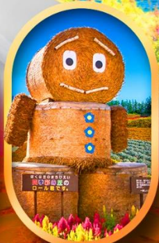
ซึกิโซ โนะโอะกะ