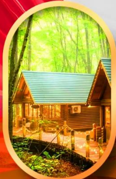
นิงเกิลเกอเรส