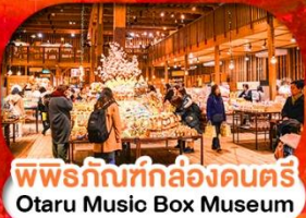
พิพิธภัณฑ์กล่องดนตรี Otaru Music Box Museum