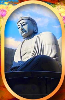
เนินเงาแห่งพระพุทธรเจ้า